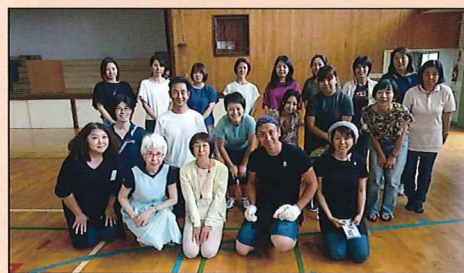
推進協の皆さんと。子ども大会にて。

秋には、体育振興会主催の「地区体育祭」。でも、今年は残念ながら台風で中止になりました。今年はおもう一つ、3年ごとに行うワコール主催の「つぼみスクール」を行いました。これからも5つの単位子ども会が協力して子ども達のために学区内のイベントを盛り上げるお手伝いをしていきます。