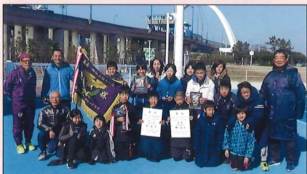
大活躍した小学生チームのみなさん

令和2年1月13日(成人の日)に柳島スポーツ公園をスタート・ゴールとして第82回高南一周駅伝競走大会が開催されました。