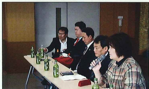
(上)手前が市議会議員のみなさん。奥は運営委員のみなさん。