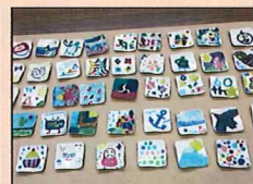
ユニークな作品の数々