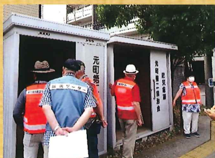
元町第二自治会防災倉庫