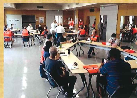
見学後の意見交換会

茅ヶ崎地区防災リーダーフォローアップ研修を7/9(土)に実施し、新型コロナウイルス感染拡大前から企画していた、地区内の防災倉庫見学がようやく開催できました。