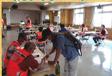
最初にコミセンで受付