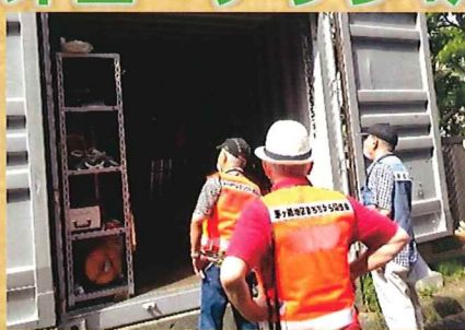
パークタウン茅ヶ崎自治会防災倉庫