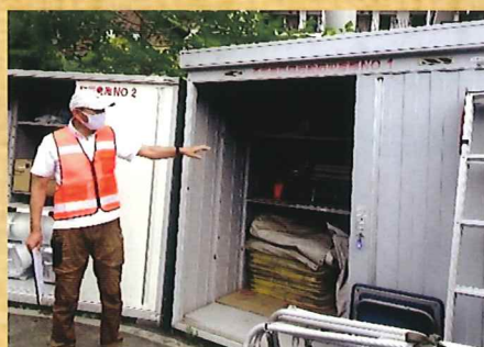
本町第四自治会防災倉庫