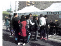
模 擬 店