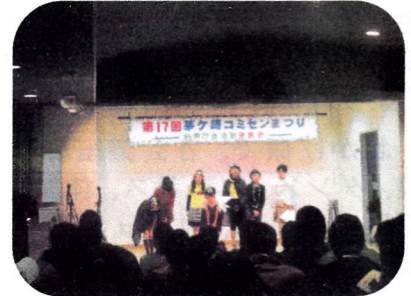
梅小生のパフォーマンス