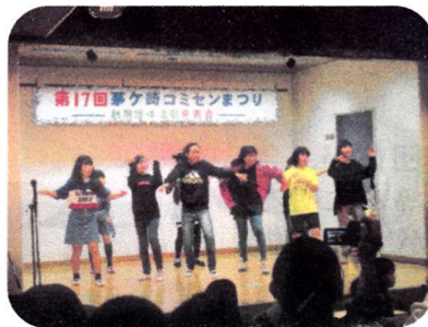
梅小生のスマイルダンス