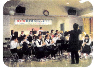
梅 中 吹 奏 楽 部