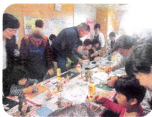
み ん な で 工 作