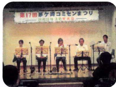
尺八等楽器の演奏