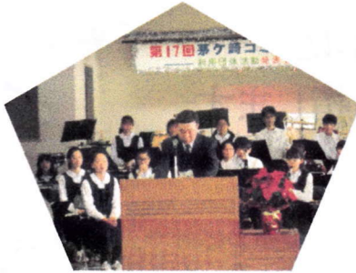
開 会 式

開会式の後、梅田中学校吹奏楽部の演奏で、まつりが開幕。 会場いっぱいに響きわたる軽快な演奏に、祭り心が弾みます。