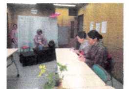
お 茶 席