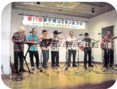
ハワイアン音楽歌