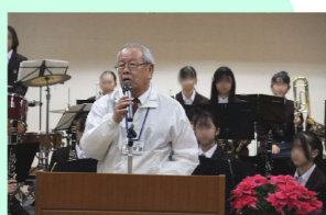
コミセン会長挨拶