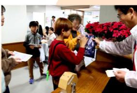
小学生ボランティアが大活躍