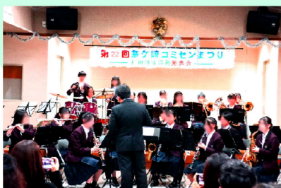
梅田中学校吹奏楽部による演奏 全国トップクラスの実力は圧巻でした！

ご来場いただいた皆さまをはじめ、ご協力をいただきましたすべての皆さまに心からお礼を申し上げます。