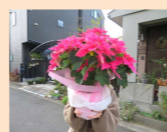
賞品のポインセチアが当たりました！