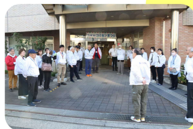
スタッフもがんばりました

令和7年11月16日に「第22回茅ヶ崎地区コミセンまつり」を開催しました。当日は好天に恵まれ1,200人に及ぶ方々にご来場いただきました。