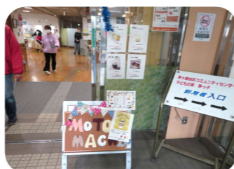
元町ケアセンター カフェはこちら