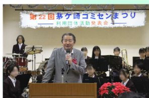
市長からのご祝辞