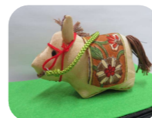
みなさまの1年が ウマくいきますように

毎年素敵なプレゼントを贈ってくれる梅田小なかよし級さんから「2026年版版画カレンダー」をいただきました。手作り版画のデザインはクリーム色を背景に、今年の干支である馬が蛍光色で生き生きと表現されています。