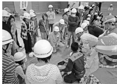
AED 訓練 (浜須賀中学校)

さらに、「災害時の被害を最小限に食い止めるための活動」について取り組んで参ります。よろしくご協力をお願いいたします。