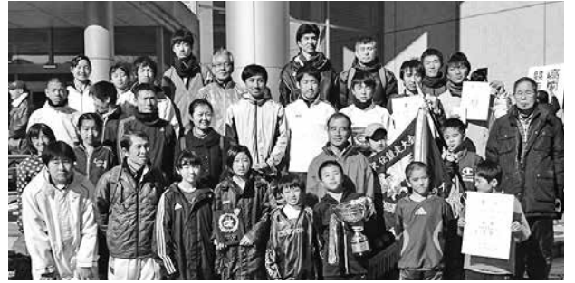
頑張ったね、浜須賀チーム!

■茅ヶ崎市主催の大会への参加 次の地区別親善大会の報告は、次号でさせていただきます。