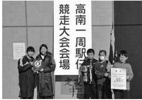
小学生の部(地区対抗) 2年ぶりの優勝!

目を迎える新たな出発となります。この地区も高齢化が進み、各事業についての実施方法、内容をより充実した形となるよう工夫したいと思えます。今後皆様のご支援、ご協力をお願いいたします。