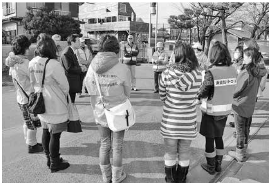
「ハマスカサポーター」結成!

合唱」での参加もしました。練習を繰り返して、当日は100名近い大人の合唱を披露することができました。合唱は好評で印象深いものになりました。記憶に新しい活動では、「浜須賀会館まつり」への参加です。おでんの販売を行いました。比較的暖かい日にも関わらず、400食全てを完売することができました。準備から販売まで保護者代表者会で協力しながら楽しく取り組む事ができました。 今後は、3月の「リサイクルバザー」の準備をしていきます。