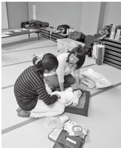
市の保健師が健康相談に乗ってくれます