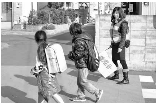
お帰り! 気をつけてね。