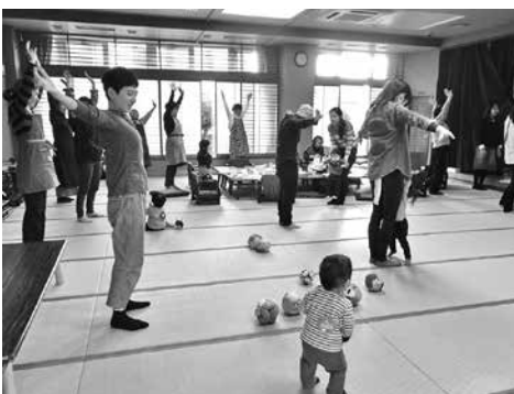
体操で一休み(サロンはますか)