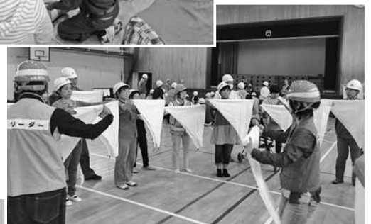
三角巾訓練 (浜須賀小学校)