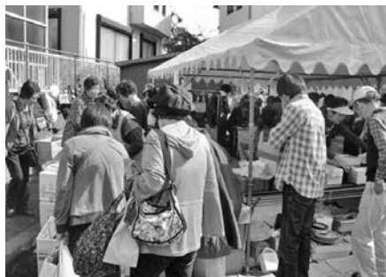
大盛況のバザーでした

平成26年10月25日(土)に開催された会館まつりにおいて、地区社協は福祉バザーを行っています。今年度も多くの方からの寄付をいただき、多くの方に購入していただきました。この収益金はふれあい昼食会等の福祉活動に活用しております。