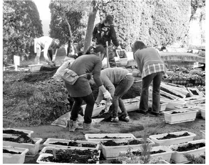
花植替えボランティア