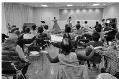
みて!きいて!うたう!たのしい音楽会

平成26年9月1日に発行した創刊号は、A3版4ページで、しかも全戸配布でしたが、今回の第2号はA4版にし、回覧用に見やすくいたしました。この度は、「浜須賀地区まちのちから協議会」のそれぞれの団体の、創刊号発行後の主な活動がわかりやすくみていただけるよう編集いたしました。皆様には、浜須賀地区で行われている諸活動を改めてご覧いただき、浜須賀地区の各種団体の取り組みやまちづくりのために積極的に参加されますようよろしくお願い申し上げます。