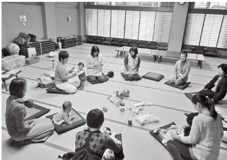
♪あなたのお名前は？ あら、ステキなお名前ね♪