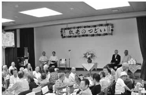
高齢者96名の参加がありました

平成26年9月6日(土)に第29回「敬老のつどい」を開催いたしました。77歳以上の方96名参加、米寿のお祝い対象者は46名おり、そのうち12名の参加がありました。これは今までにない多くの方の出席となりました。