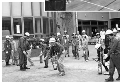
消火訓練(緑が浜小学校)