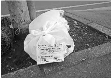
イエローカード! ルールを守ってね

「浜須賀地区まちのちから協議会」の環境部会は地域の環境指導員が日々、皆様のごみ・資源物の出し方の指導、置き場の管理をしています。茅ヶ崎市のごみの総排出量は昨年度も市民の協力で減少してきています。しかし、燃やせるごみとして出された中には、まだまだ紙類、ダンボール、「フラ」マークのあるプラスチック包装容器類、発泡スチロール箱などが資源物として分別されずに多く含まれ出