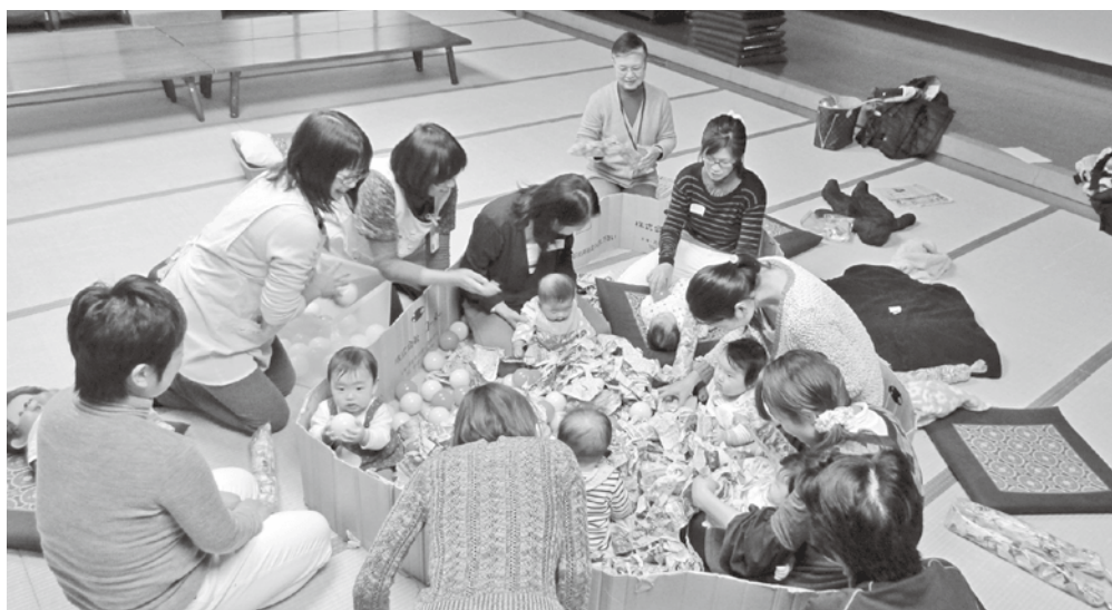
新聞紙とボールのお風呂で、みんな一緒