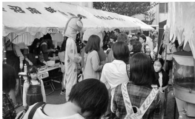
模擬店会場(浜須賀会館まつり)

んの美味しい焼きそばや磯辺焼き・おでん・焼き鳥・綿あめ・ポップコーンなどの模擬店。また浜須賀小学校仲よし級の皆さんの手作り作品の販売、社協(浜須賀地区社会福祉協議会)の福祉バザー、マドレーヌや手作り品。館内にはサークルの皆さんによる一年間の成果の作品展が。また、つつじ学園・浜須賀保育園・浜須賀小学校・浜須賀中学校の児童・生徒さんの作品展もあり、賑やかに行われました。お楽しみ抽選会も皆さんの楽しみの一つとなっております。