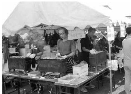
浜須賀会館まつり 大人気のやきとり!