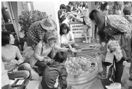
浜須賀会館まつり ヨーヨー釣りだ!