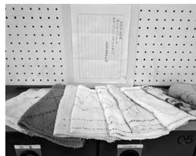
手作り雑巾、ありがとう

先日、とてもうれしいことがありました。浜須賀中学校8組の生徒さんが、「雑巾をつかって下さい。おそうじにつかって下さい。」と手紙を添えて、手作りの雑巾を沢山持ってきてくれました。うれしいですね、大切に使用させていただきます。