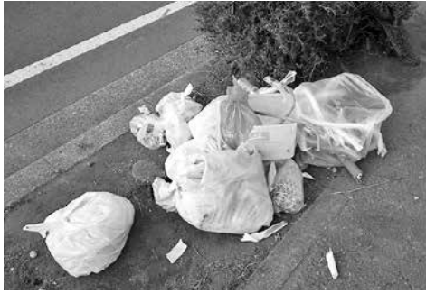
正しくないような...

無事かつ有意義に実施出来ましたのは、日頃より皆さんの防災意識の高揚の表われと思います。