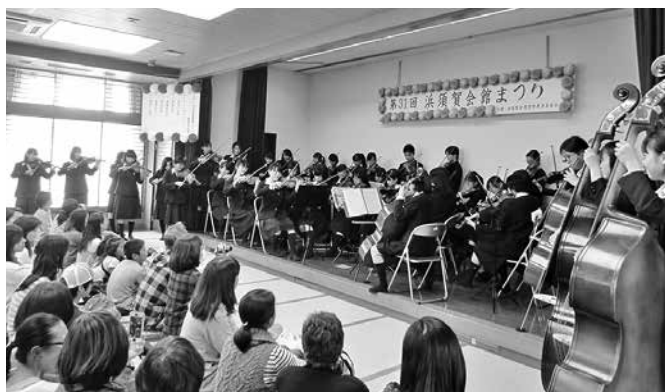
浜中弦楽合奏部による演奏(浜須賀会館まつり)