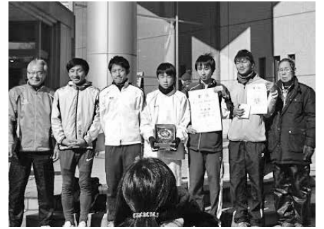
男子1部(地区対抗) 準優勝!