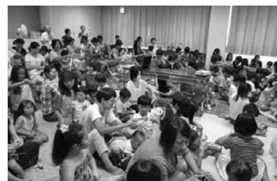
大盛況!夏休み子ども映画会

先日、とてもうれしいことがありました。浜須賀中学校8組の生徒さんが、「雑巾をつかって下さい。おそうじにつかって下さい。」と手紙を添えて、手作りの雑巾を沢山持ってきてくれました。うれしいですね、大切に使用させていただきます。