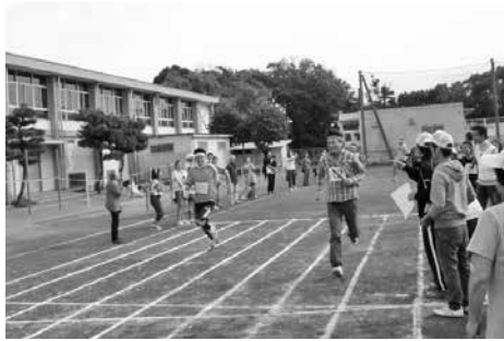
一番の盛り上がり 自治会対抗リレー