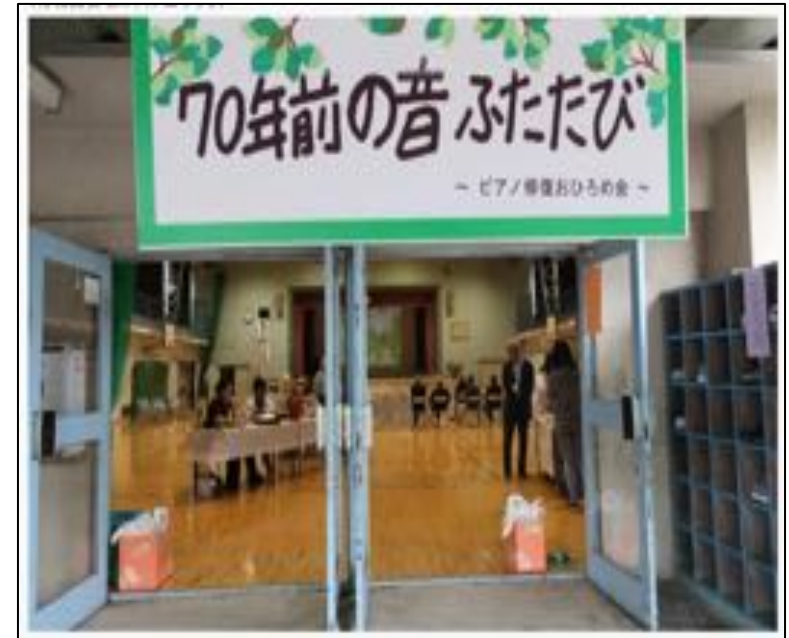
令和元年5月に寄贈ピアノお披露目の会を開催