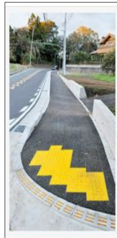
新たに整備された歩道