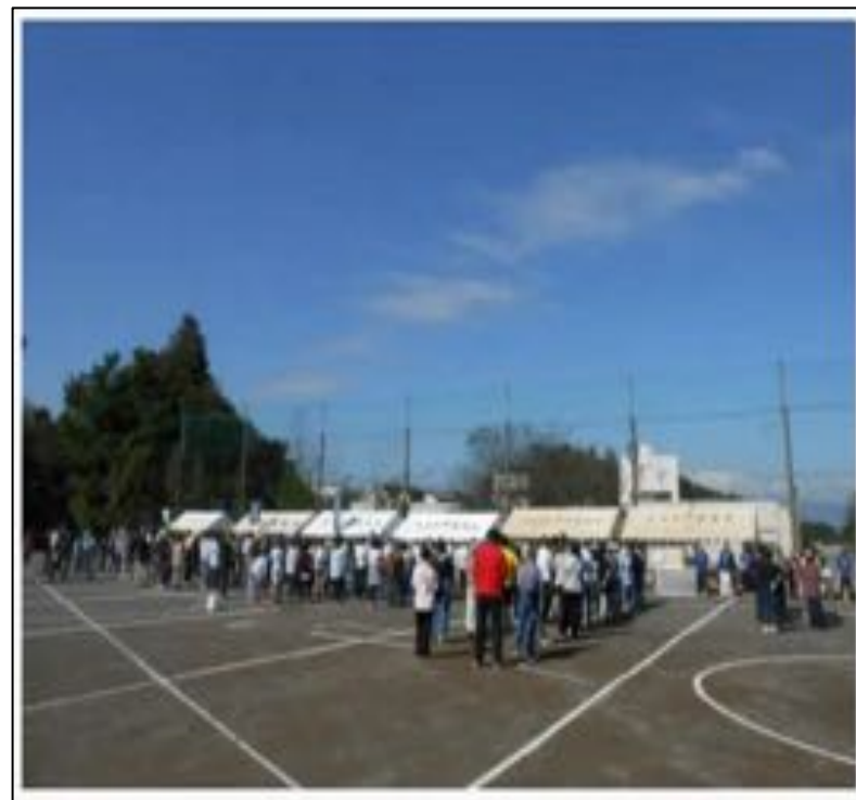
平成29年度地区体育祭の様子