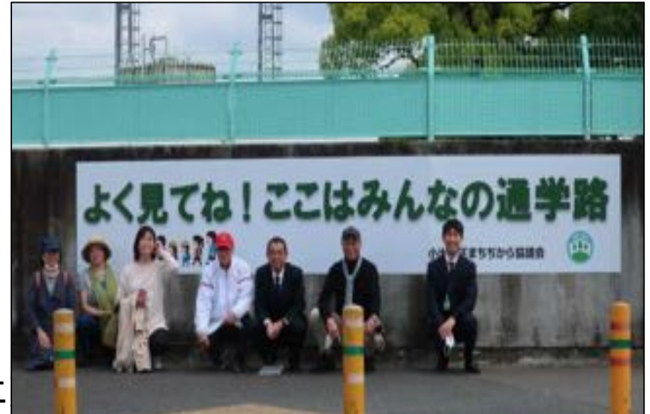
令和2年4月に安全安心看板を設置