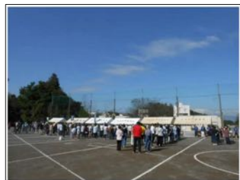
平成29年度地区体育祭の様子