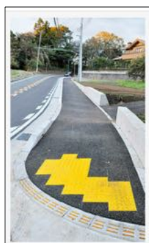
新たに整備された歩道