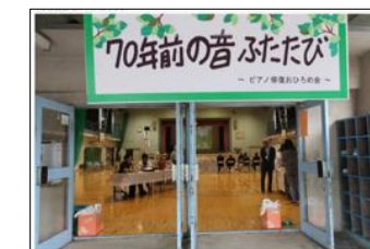
令和元年5月に寄贈ピアノお披露目の会を開催