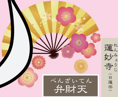
べんざいてん 弁財天