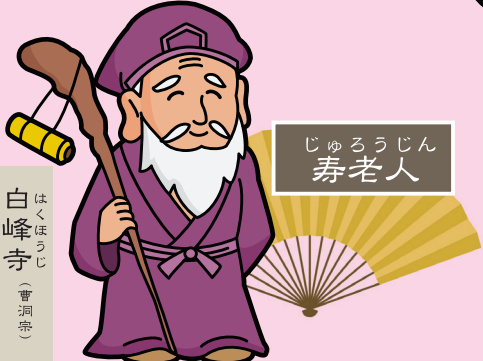
じゅろうじん 寿老人