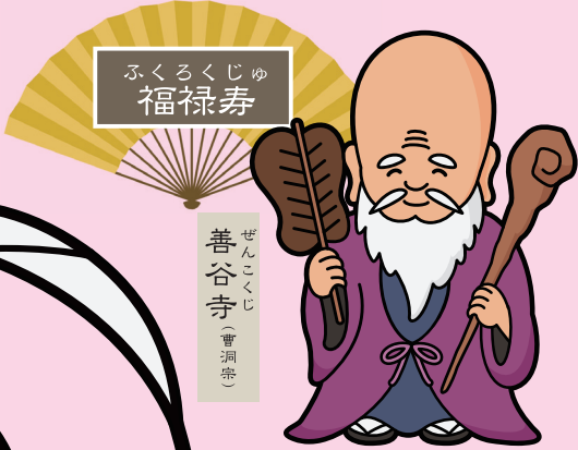
ふくろくじゅ 福祿寿