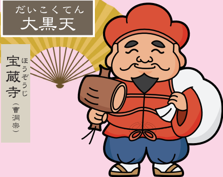
だいくくてん 大黒天