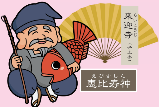
来迎寺 (浄土宗) えびすしん 恵比寿神