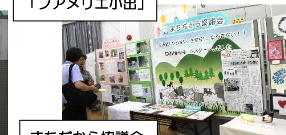
まちぢから協議会