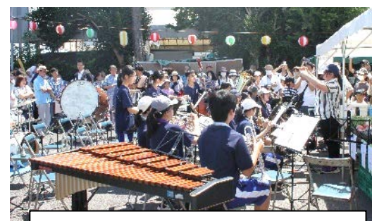
オープニングは「北陽中吹奏楽部」