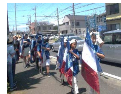
「小出リトルフラッグス」 コミセンから皆楽荘まで行進