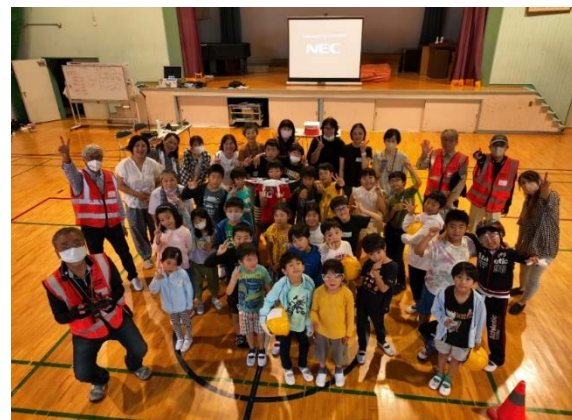
ドローンのカメラでみんな一緒に記念撮影

子どもたちからの感想として、「最初は難しかったけど、どんどん楽しくなった」「説明がわかりやすくてすぐに慣れる事が出来た」「ドローンの操縦やプロペラの構造が学べた」「楽しかったからまたやりたい」など、自分で初めてドローンを操縦したうれしさを伝えてくれました。また、「どこでドローンは買えますか」「いくら位しますか」などの質問もあり、自分のドローンが欲しくなった子ども達がたくさんいました。また第二弾が出来ます様に・・・