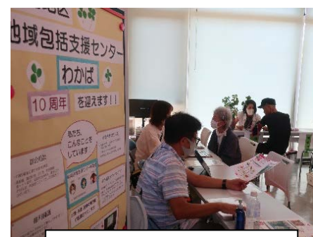
地域包括支援センター 「わかば」