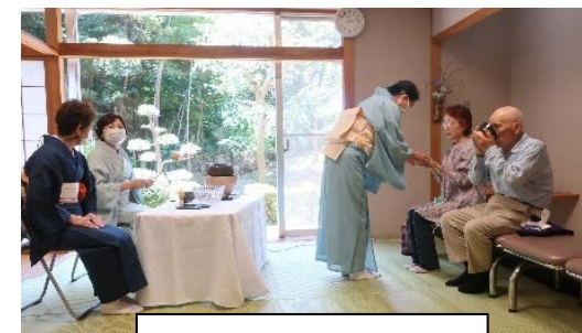
「小出茶道サークル」