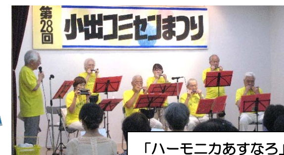
「ハーモニカあすなろ」