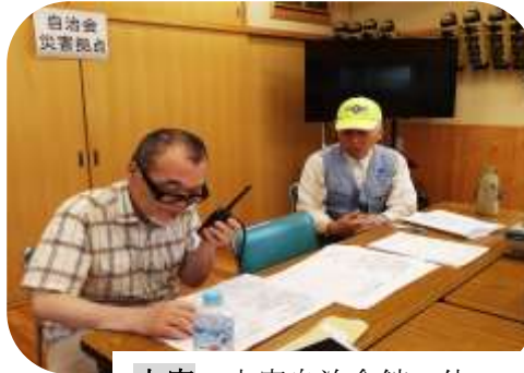
本宿…本宿自治会館 他