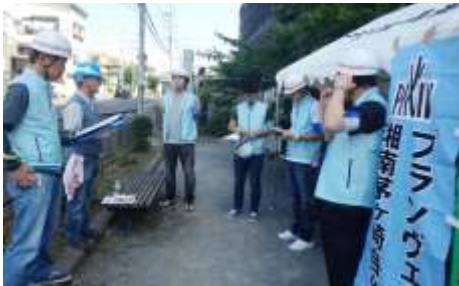
プランヴェール小和田北公園