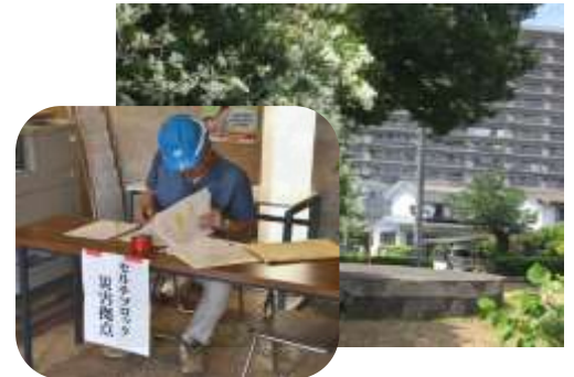
赤松町…丸池公園 他