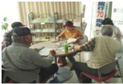
新宿…小和田コミセン 他