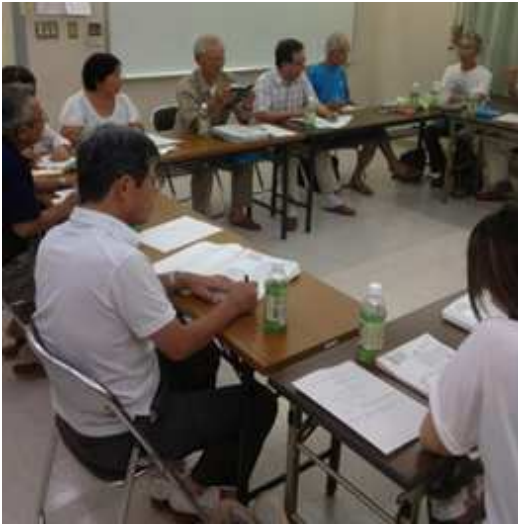
規約の細部にわたり話し合いました。

協議会立ち上げまであとわずかとなりました。小和田II輪作りII和作りで、小和田地区の未来を一緒に考えましょう！