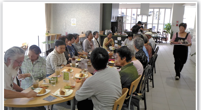
お客様で賑わう店内