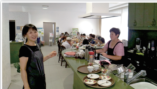
お客様で賑わう店内