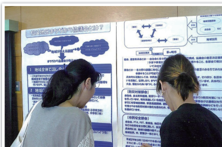
展示コーナー(松浪地区まちぢから協議会の紹介)