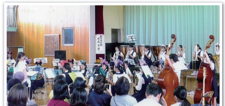
ステージ(松浪中・吹奏楽部)