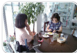
くつろぎのティータイム