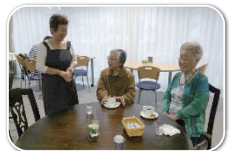
お客様とスタッフの笑顔