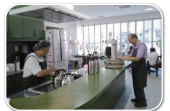
男性スタッフもいます