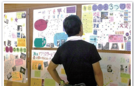
展示コーナー(中学生の作品)