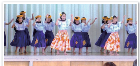
ステージ(フラダンス)

まつりを開催するにあたっては事前の3回にわたる実行委員会を経て、前日の準備、当日ボランティア、後片付けと、たくさんの地域の方々や中学生の力が結集されました。松浪地区の底力が見えた様なまつりでした。