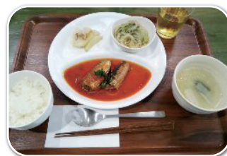
イワシのトマト煮