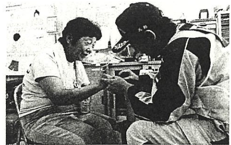
平成30年7月豪雨災害での救護活動

平時から災害に備え、医療救護の為に資機材の整備や、大規模災害を想定した訓練を実施しております。