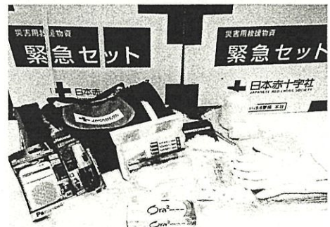
歯ブラシやタオル、ラジオ等の日用品の緊急セット

避難された方の中には、災害に対する恐怖や不安から不眠症になる人も少なくありません。少しでも睡眠できるようにアイマスクや耳栓などの安眠セットもお配りしております。