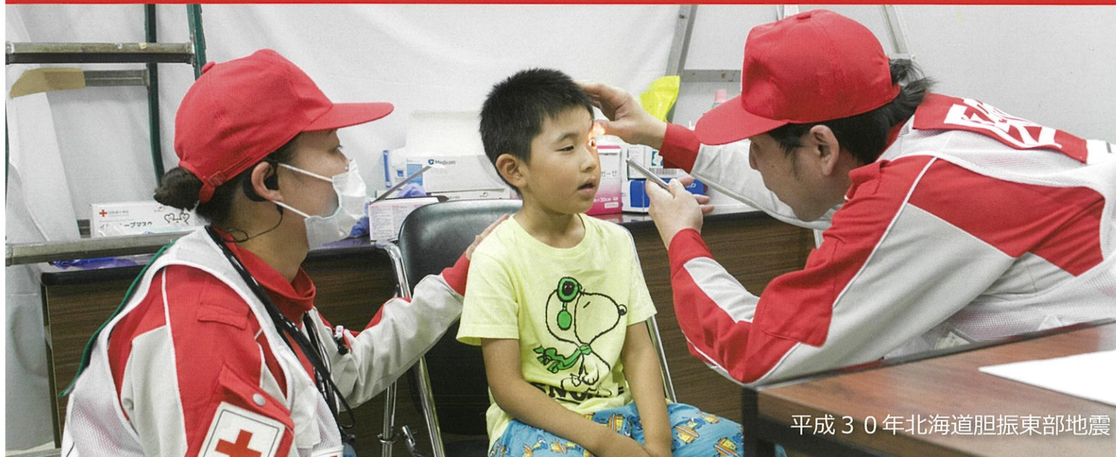
平成30年北海道胆振東部地震

みなさまからのご寄付は、災害救護活動をはじめとしたいのちを支える様々な活動に活用させていただきます。