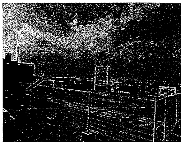
屋上にある津波一時退避スペース