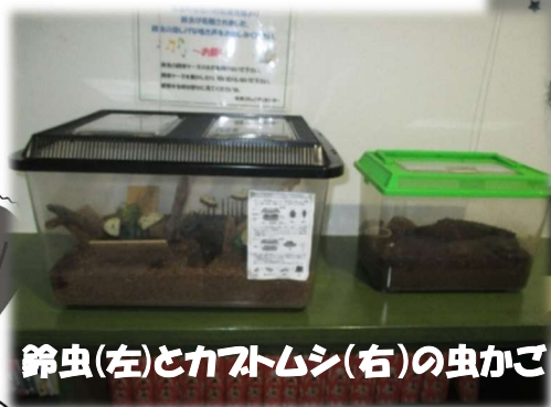
鈴虫(左)とカブトムシ(右)の虫かご