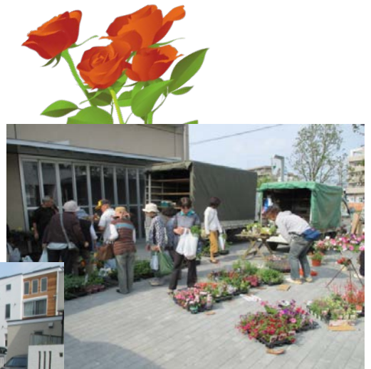
季節の花々がとても綺麗です