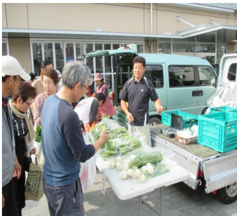
新鮮な野菜が豊富です