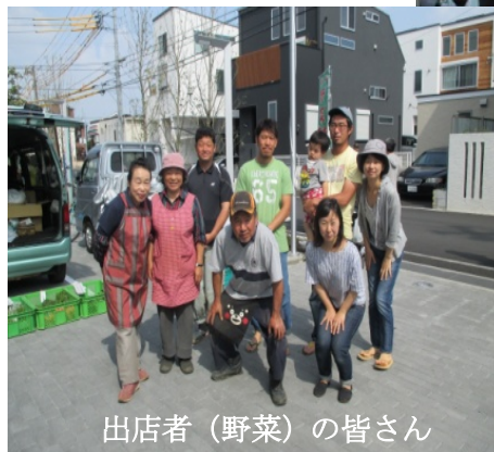
出店者（野菜）の皆さん