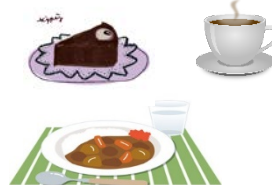
ランチが大人気です！