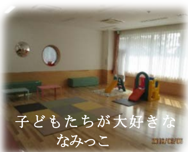
子どもたちが大好きな なみっこ

松浪コミセンがスタートして1年、たくさんの方に出会うことができました。地域の方々が毎日楽しく過ごせるように、お手伝いできたらと思っています。