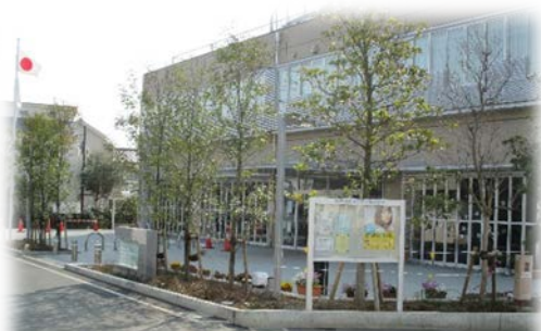
案内板を見てくださいね