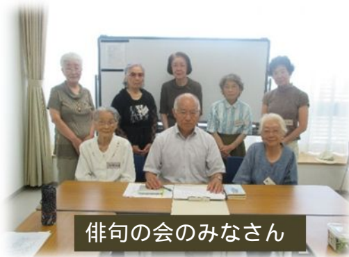
俳句の会のみなさん