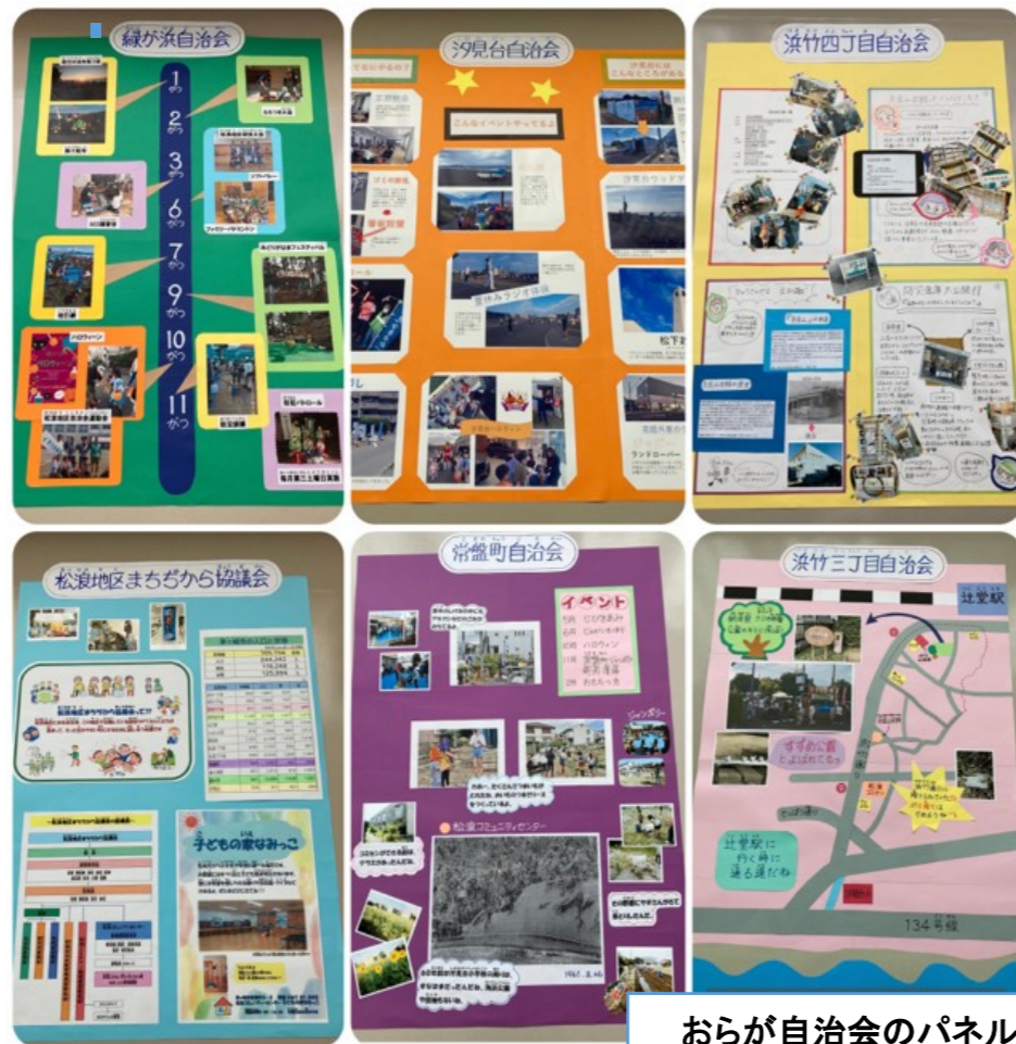
おらが自治会のパネル