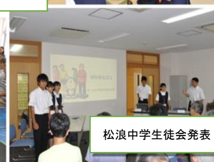
松浪中学生徒会発表