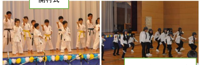
汐小ダンスクラブ