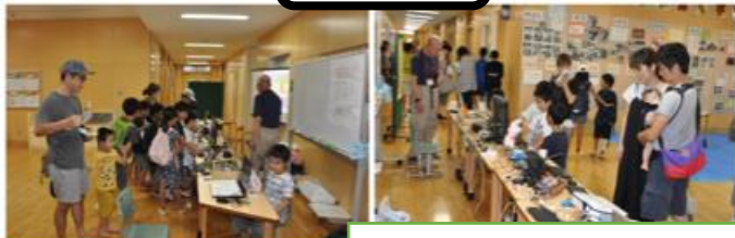
デジタルサイエンスクラブ