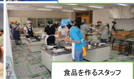
食品を作るスタッフ