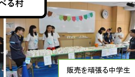
販売を頑張る中学生