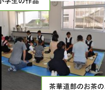
茶華道部のお茶のお手前