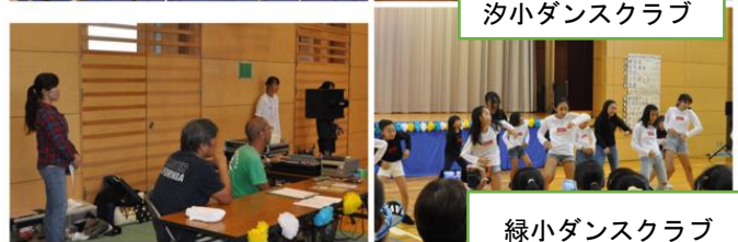
緑小ダンスクラブ