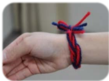
(かわいいミサンガ)