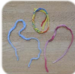
(小学生が作ったクリスマスカードとミサンガ)