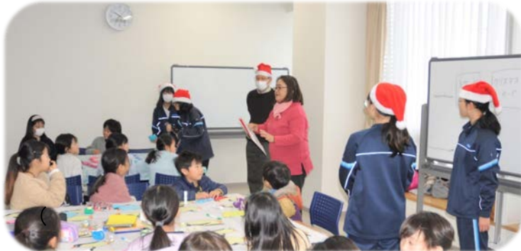
(推進協の開会あいさつ)

汐小推進協主催『第2回子ども大会』が松浪コミセンで開催されました。例年のように松浪中学校美術部の皆さんにご指導を頂きながら、小学生と幼児たち約50名がクリスマスにちなんだ作り物を楽しみました。汐小推進協の皆さんには壁掛けのクリスマスツリー、汐小PTAの皆さんにはツリーに飾るオーナメント、サンタのぼうしをかぶった浪中美術部の皆さんには3組に分かれてミサンガ、クリスマスカード、ぶんぶんごま、をそれぞれ教えて頂き、皆さん自分の作品をおみやげに持ち帰りました。