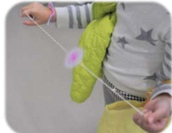
(楽しいぶんぶんごま)

今回の子ども大会には松浪中学の美術部から6名がボランティアとして参加し、クリスマスカードとミサンガ、ブンブンゴマの作り方を教える事になりました。わかりやすく伝えられるよう部活動中にも練習し工夫を重ねました。当日は50人程の小学生が集まりました。自分らしい、自分の宝物になるような作品を作って、物を作る事の楽しさを伝えられたらいいと思い臨みました。1年生から6年生まで年齢に合わせて教える事の難しさも感じましたが、良い作品が完成し喜んでくれると嬉しくなりました。この日作った物をクリスマスに誰かに作ってあげたり、誰かともう一度作ったりして楽しみが広がっていくといいなと思います。