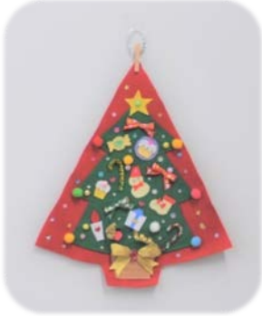
(汐小推進協の壁掛けツリー)