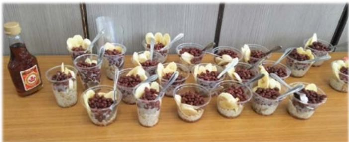
(ランチのしめはあずきのデザート)