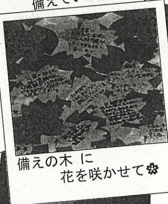
備えの木に 花を咲かせて