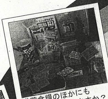
備蓄食糧のほかにも 備えていますか？

実際の取り組みを 「見て」「知って」 いまいちど 災害への備えを 確認しましょう。