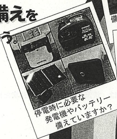
停電時に必要な 発電機やバッテリー 備えていますか？