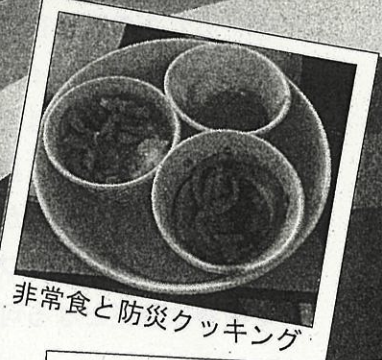
非常食と防災クッキング