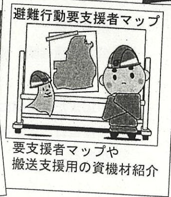
避難行動要支援者マップ