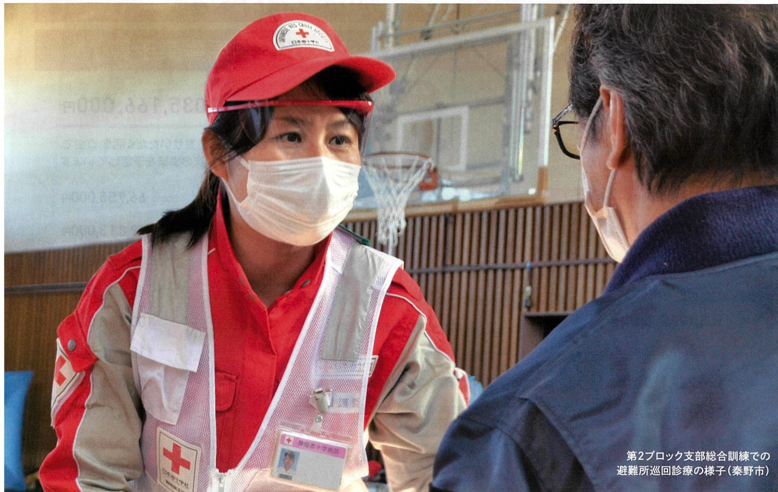
第2ブロック支部総合訓練での 避難所巡回診療の様子(秦野市)