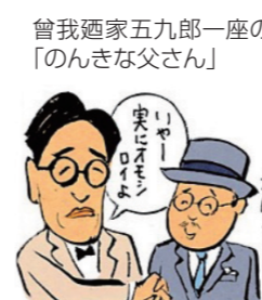
曾我廼家五九郎一座の「のんきな父さん」 拓風先生! 実にオモシロイ!