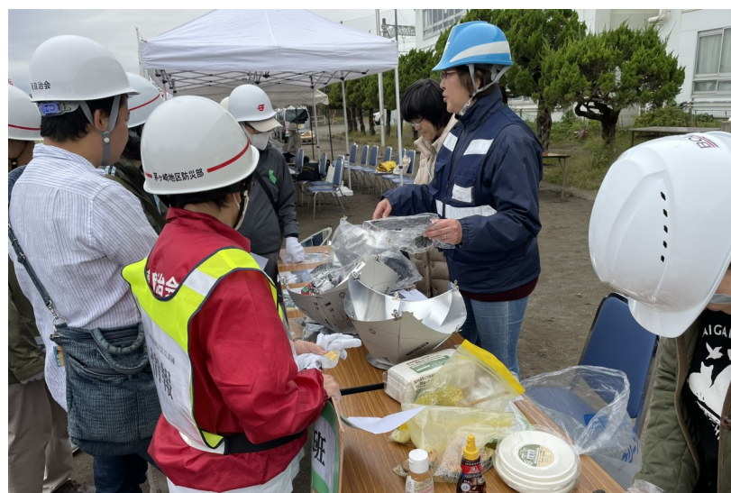
ソーラークッキング