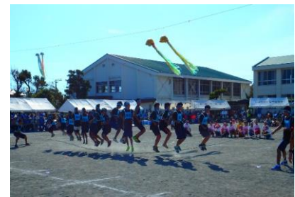
【みんなでジャンプ競技:優勝】