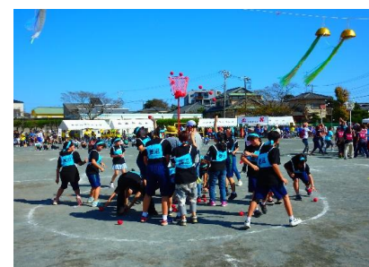
【女子による玉入れ競技】