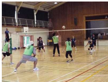
男女混合バレーボール大会