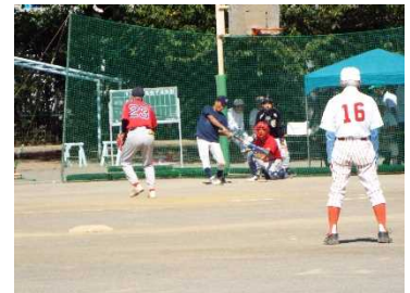
ソフトボール大会