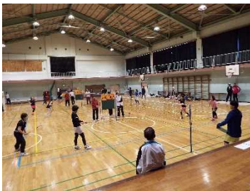
バドミントン大会

いろいろと書きましたが、体育振興会に関係する多くの方々のご理解とご協力なくして活動することはできません。今後とも松林地区体育振興会をよろしくお願いいたします。