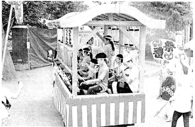
5月からの練習お疲れ様、ご苦労様でした。