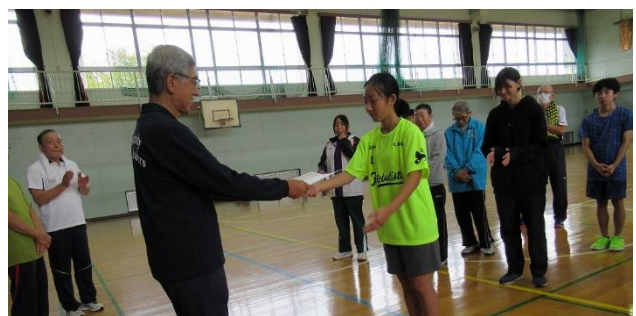
参加された皆さん、お疲れ様でした。