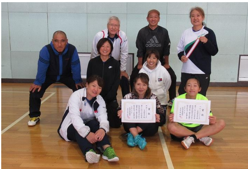
優勝・第3位の下赤羽根チームです。

予選は10チームを抽選で3チームずつ A・B グループと4チームグループ C に分けリーグ戦を行い、その後、各グループの1位、2位、3位・4位グループで順位戦を行いました。1試合は15点3セットマッチです。チーム3名に満たない自治会は推進委員が加わっています。2位グループの1位も総合3位としました。