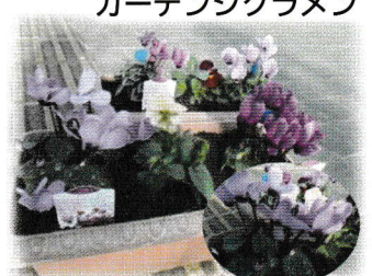
ガーデンシクラメン