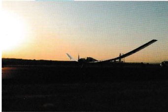
テストフライトの様子 (19年度の機体)