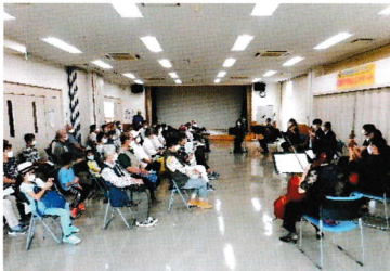
昨年のコンサート