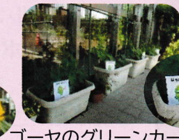
ゴーヤのグリーンカーテン