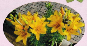
イエローカサブランカ