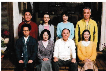
出演:橋爪 功 吉行 和子 妻夫木 聡 他