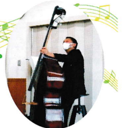
楽器の説明や曲の 紹介、楽しいお話 もこのコンサートの 聴きどころ

懐かしい唱歌・歌謡曲・耳なじみのあるクラシック など気軽に楽しめる“小さくて贅沢な音楽会” お子さん連れ大歓迎!です。是非ご家族そろって お出かけください。