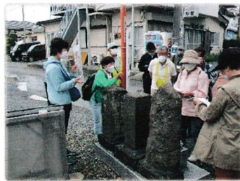
えな塚 庚申塔など について説明する様子