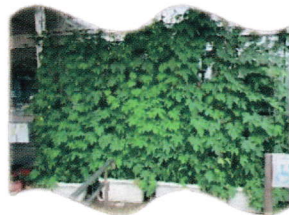
ゴーヤのグリーンカーテン