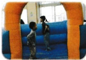
エアトランポリン 飛んだり跳ねたり 大騒ぎ