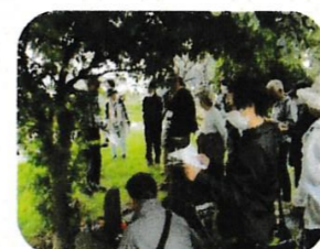
鶴嶺八幡宮松並木の 途中にある馬頭観音