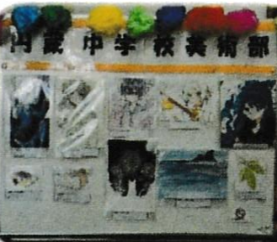
円蔵中学校美術部