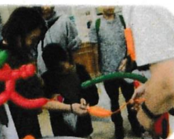
何ができるか？興味津々 バルーンアート