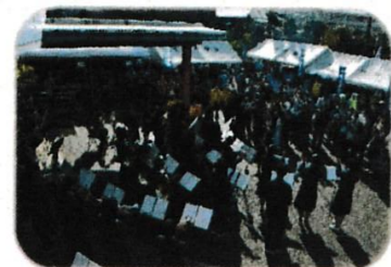
気持ちの良い秋の朝 ご来賓の皆さまも笑顔です