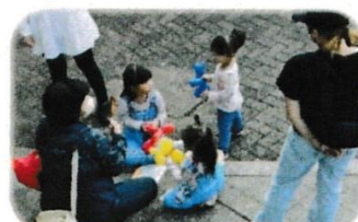
みて、わたしのも上手 でしょ！