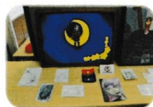
鶴嶺中学校美術部