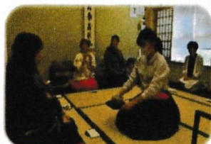
鶴嶺中学校家庭部によるお茶席 美しい所作に騒がしい日常を忘れ られました