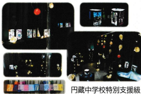
円蔵中学校特別支援級