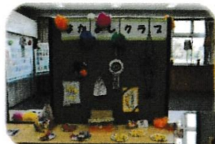
学童保育 なかよしくラブ