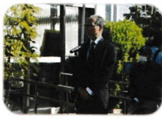
尾坂センター長による挨拶