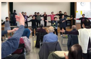
みんなで身体を動かしました