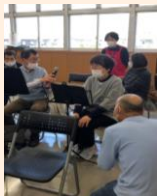
お隣の方とお知り合いに