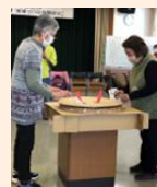
昔懐かしトントン相撲 なぞなぞ しりとり