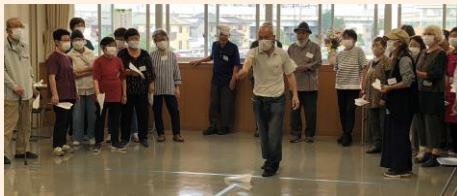
子どものころ作った紙飛行機