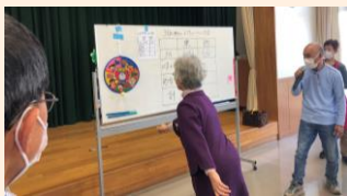
3月レクリエーション大会の続きで的当てゲーム