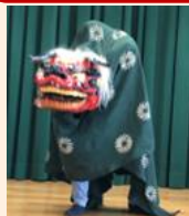
獅子舞いで無病息災を