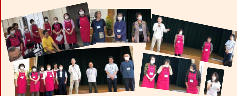
サロンでお手伝いをします