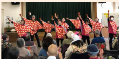
皆さん鳴子を振って一緒に!