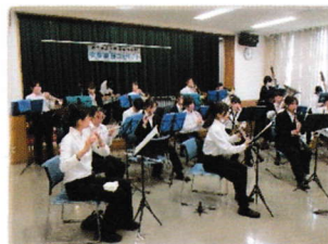
奏でる思い出の曲

約1時間、6曲の演奏会でしたが、皆さまから「懐かしい曲を聴き、当時のことを思い出して感動しました」、「吹奏楽の伴奏で歌えるなんて、とてもうれしい経験でした」などのお声をいただきました。