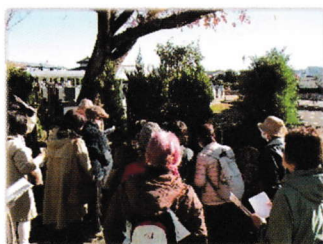
懐島山龍前院内の庚申塔