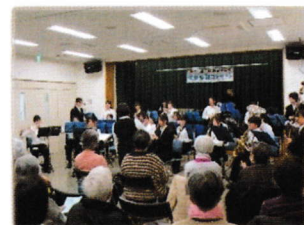
聴き入る観客の皆さま