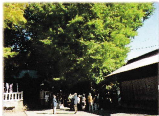
鶴嶺八幡宮大イチョウ

「懐島山 龍前院」敷地の奥にあるたくさんの五輪塔や、一の鳥居近くの「弁慶塚」などはご存じなかった方もあり、大変興味深かったと感想をいただきました。