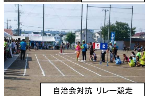
自治会対抗 リレー競走