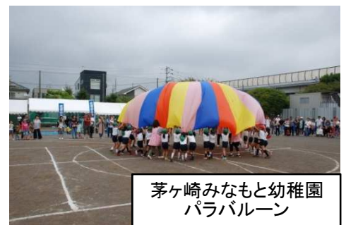
茅ヶ崎みなもと幼稚園 パラバルーン