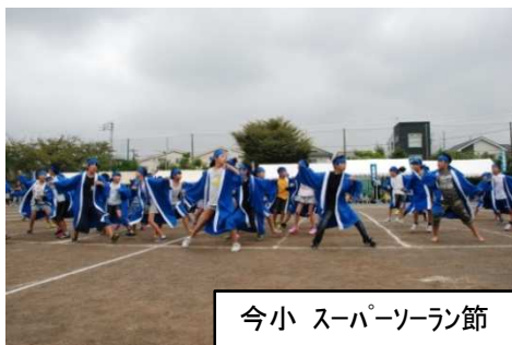
今小 スーパーソーラン節