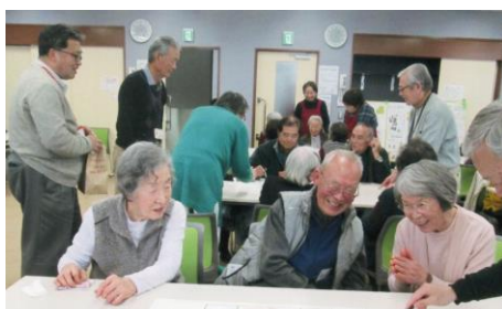
包括みどりのビンゴゲームで大盛り