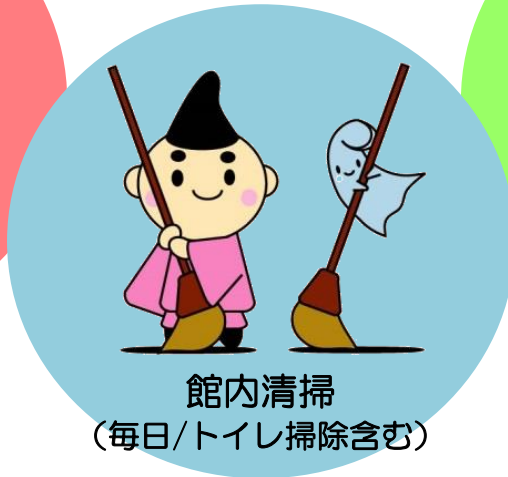
館内清掃 (毎日/トイレ掃除含む)