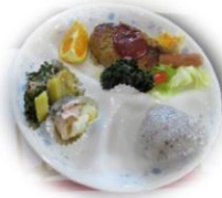
↑この日のメニューは みんな嬉しいハンバーグ

楽しんで料理 (料理スタッフで) みんなで準備 (参加者有志で) 楽しい食事 (全員で) みんなの居場所に!